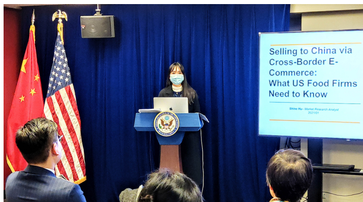
美国驻沪总领事馆农业贸易处邀请演讲

► 持续加强与全球合作伙伴的交流合作，同加拿大领馆、捷克领馆、新西兰贸易发展局、瑞士领馆、菲律宾大使馆、西班牙领馆、欧盟商会、英中贸易协会、澳洲营养补充剂协会、澳洲出口协会、法国化妆品协会及西班牙化妆品协会等组织在合规领域、品牌发展方面进行更为密切的合作，提升优质海外品牌方的知名度及合规安全性，顺利进入中国市场，还与部分机构达成框架合作协议，互惠互利，共同发展。